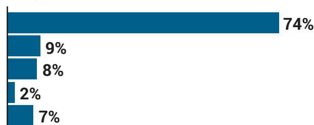
РИС. 2. ЧТО ПРОИСХОДИТ С ЗАРПЛАТОЙ СОТРУДНИКОВ

Уровень зарплаты остается без изменений — 74% Сокращается на 5–10% — 9% Сокращается на 10–20% — 8% Сокращается на 20–30% — 2% Другое — 7%